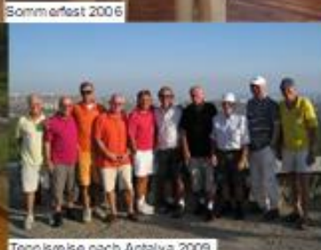
Tennisreise nach Antalya 2009