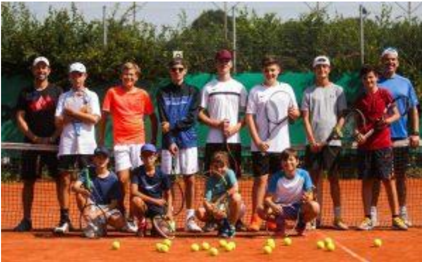
BU: Teilnehmer des SG-Tenniscamps

Es wurde täglich von 10-12 und 13-15 Uhr auf fünf Plätzen trainiert und jeder Trainingstag mit einem Konditionsteil und weiteren Übungsformen abgerundet. Robby und sein Team der Tennis-Arena sorgten für das tägliche Mittagessen und Jürg Schwarz für die kostenlose Bereitstellung des Sportparks Offenthal an den beiden Regentagen. Beim Abschlussturnier am letzten Tag konnten alle Teilnehmer ihr Können unter Beweis stellen und bei der anschließenden Siegerehrung schöne Sachpreise entgegennehmen.