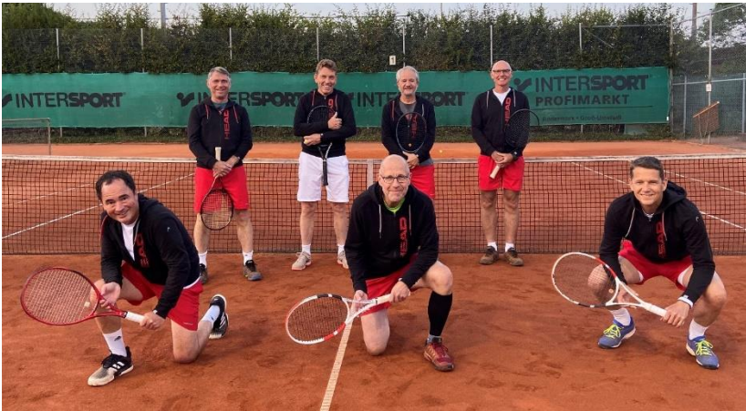
Das Herren 55 Meisterteam 2020 in „Corona-konformer“ Formation