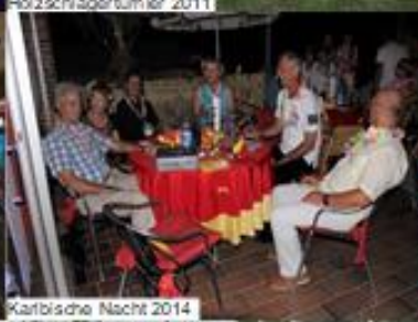
Karlische Nacht 2014