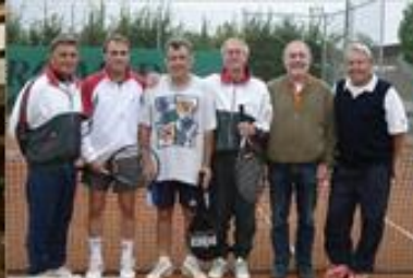
die UHUs 2005