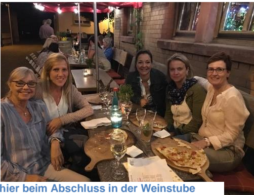
hier beim Abschluss in der Weinstube

Am letzten Spieltag bekamen es die Damen mit ehemaligen Tischtennis-spielerinnen zu tun. Die Damen des TC Martinsee II hatten so manchen "Schlenker mit dem Handgelenk" auf Lager, der die Bälle doch manchmal unberechenbar machte. Diese Partie endete trotzdem mit einem 4:2 für die SG und einem sehr geselligen Abend auf der heimischen Terrasse, weil es auch die Damen aus Heusenstamm bei uns sehr gemütlich fanden. Nach der Sommerpause konnte die Mannschaft die letzten beide Spiele für sich entscheiden und die Damen 40 II erzielten überraschend den 3. Platz von acht Mannschaften.