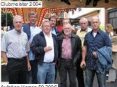
Aufstieg Herren 50 2006