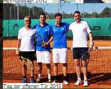
Tag der offenen Tür 2015