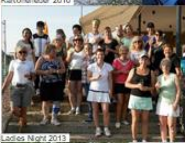
Ladies Night 2013