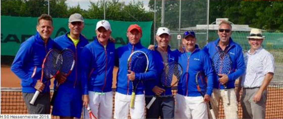
H 50 Hessenmeister 2016