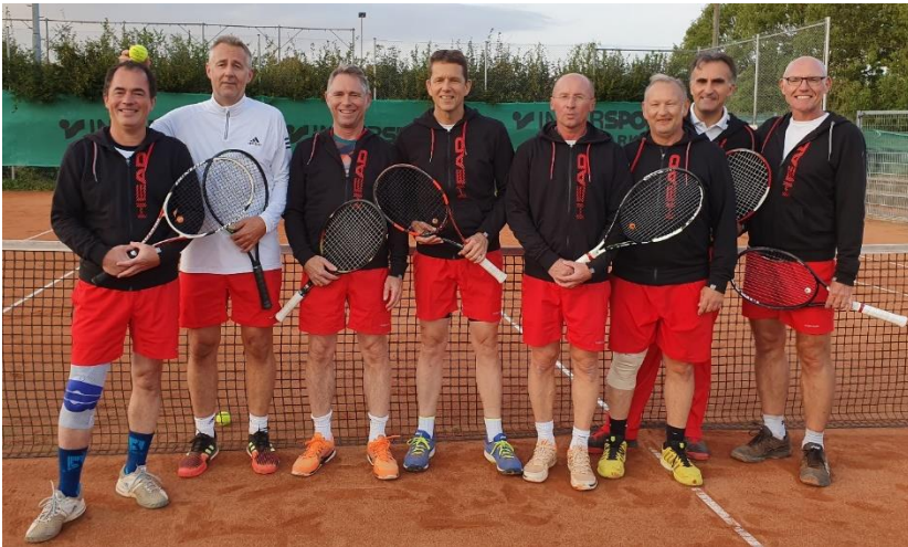
Das Team Herren 50 von 2019